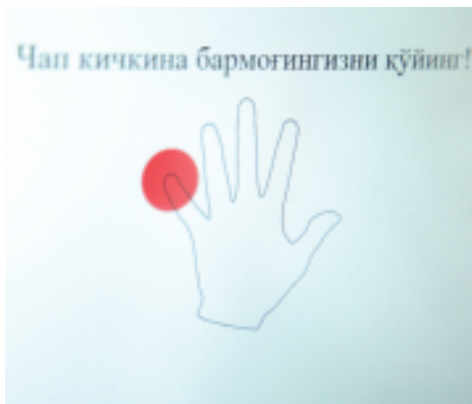
Чап кичкина бармоғингизни қўйинг!

Гап шундаки, ми-жоз ўз ҳисобварағи бўйича амали-