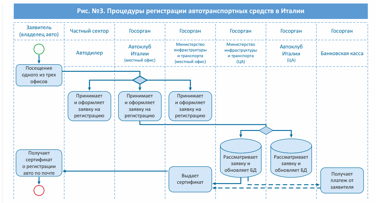
Рис. №3. Процедуры регистрации автотранспортных средств в Италии

Пользователями системы на данном этапе являются сотрудники местных офисов АКИ, Управления наземного транспорта, а также автодилеры.