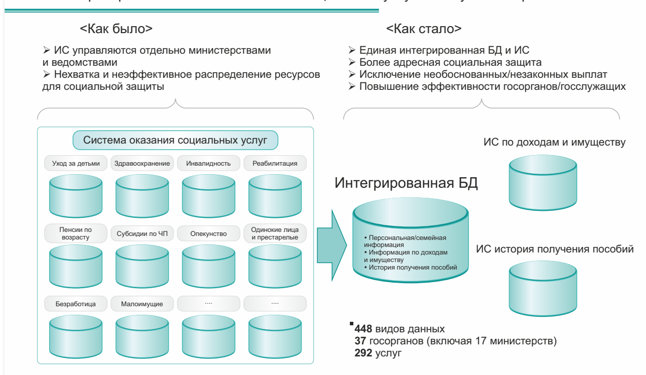
Рис №1. Преобразование системы оказания социальных услуг в Республике Корея

Администрация Пак Кын Хе, избранной на пост президента в 2013 году, позже во время избирательной кампании заявила, что «социальная система должна подходить для пользователей любого возраста». Таким образом, разработка Информационной системы социальной безопасности стала еще более важной задачей на пути к выполнению обещания.