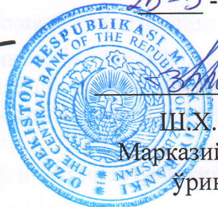
Ш.Х. Атабаев Марказий банк Раиси ўринбосари